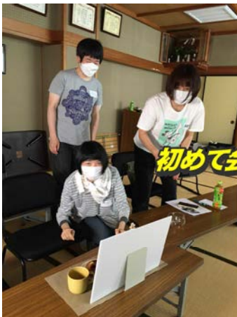
初めて会った人と