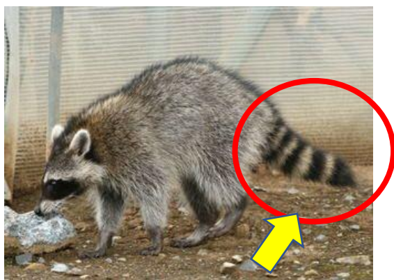
尻尾が長くシマシマ